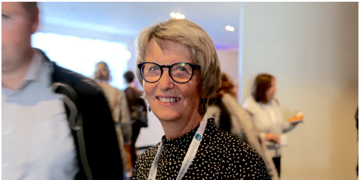
Foto: Fra fjorårets konferanse

Aldri noen gang tidligere har de pårørende vært så godt representert på Pårørendekonferansen som i år. Per nå er rundt 40 prosent av de påmeldte pårørende, noe arrangørene aldri tidligere har opplevd.